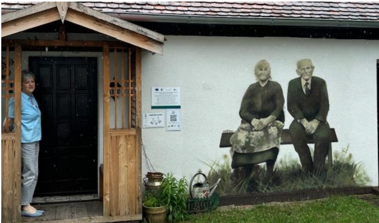
Projekt mit LEADER-Mitteln: Grafitti-Bilder von Personen aus der Dorfgeschichte auf Gebäuden...