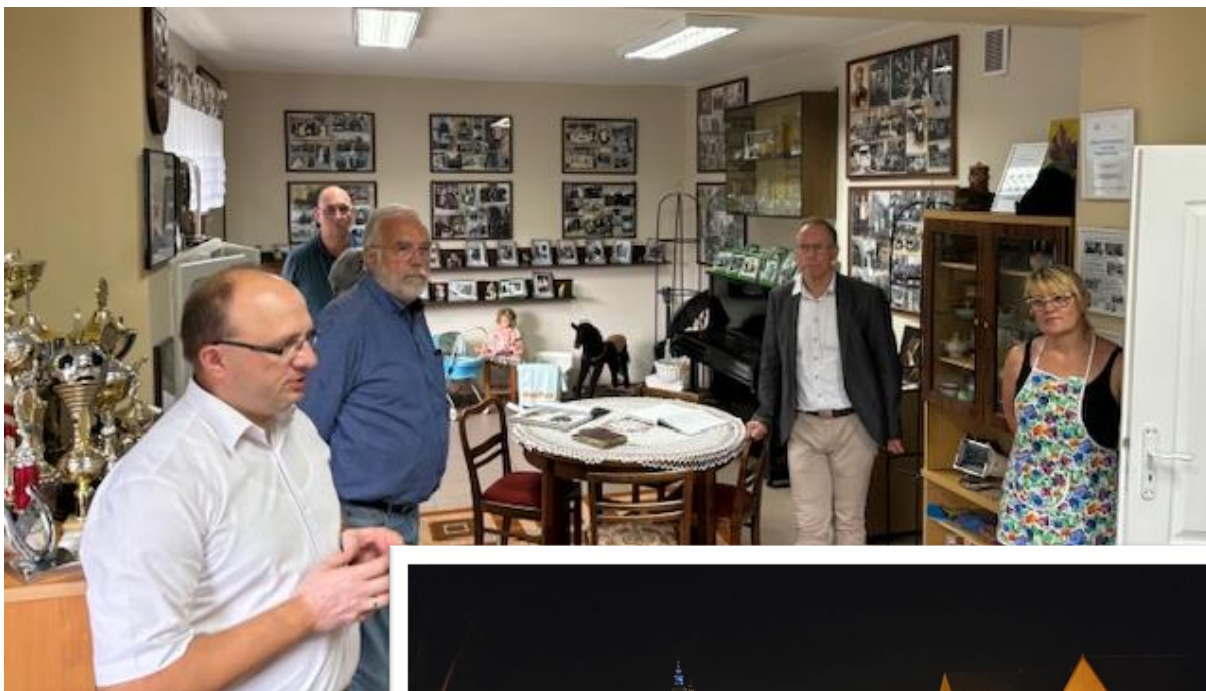
Blick ins Dorf- und Heimathaus von Pietrowka/Petersgrätz Unten: Blick auf den Dorfplatz am Abend.