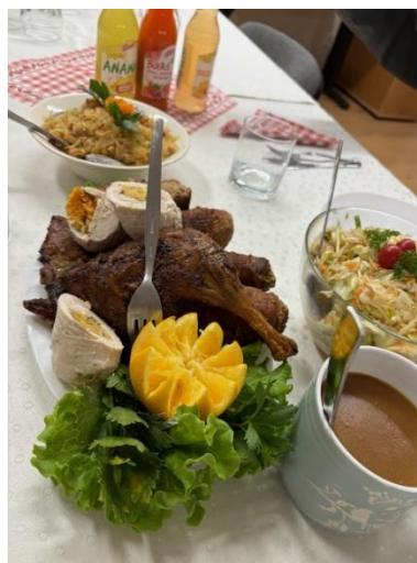
Reichlich und herzhaft: Die schlesische Küche...