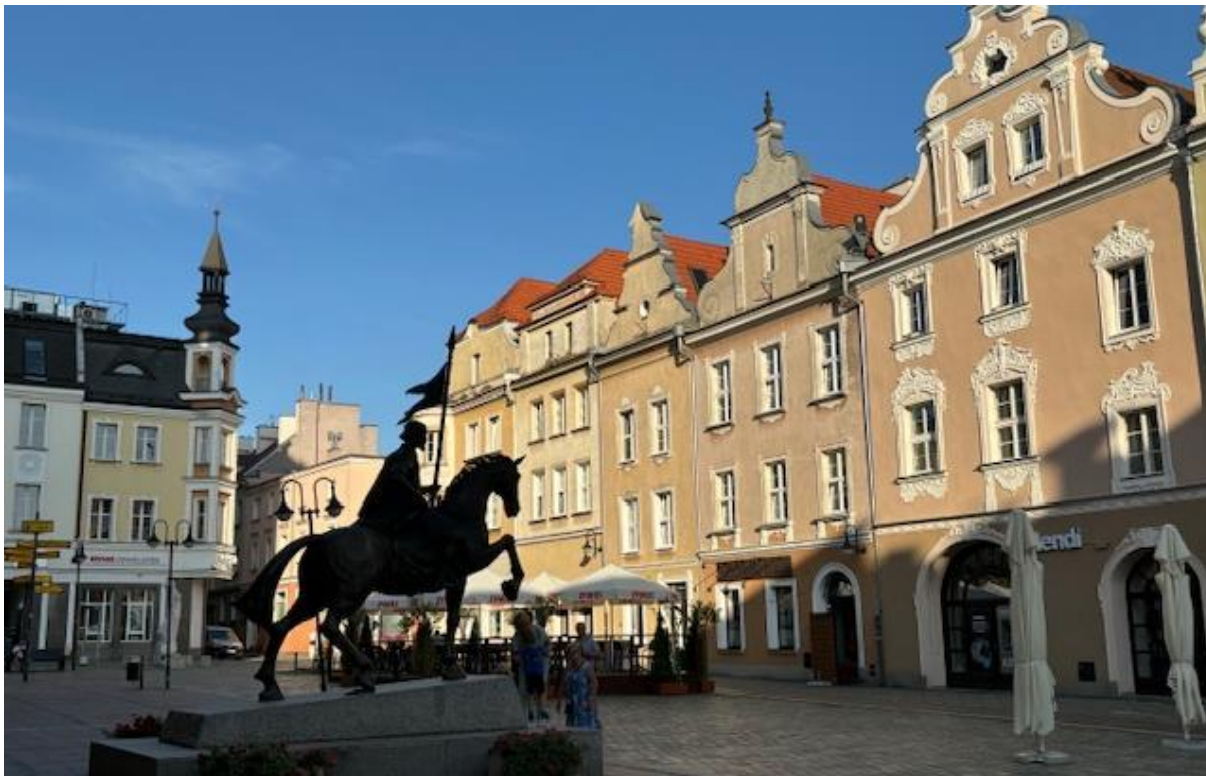
Sehenswert: die u.a. mit EU-Mitteln ansprechend sanierten Städte Polens, hier Oppeln.