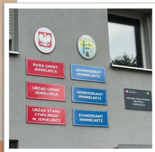
Das Staatswappen ist in allen Amtszimmern (hier im Ratssaal) und Schulklassen präsent, ebenso das Kreuz. Jemielnica/Himmelwitz ist zweisprachig: