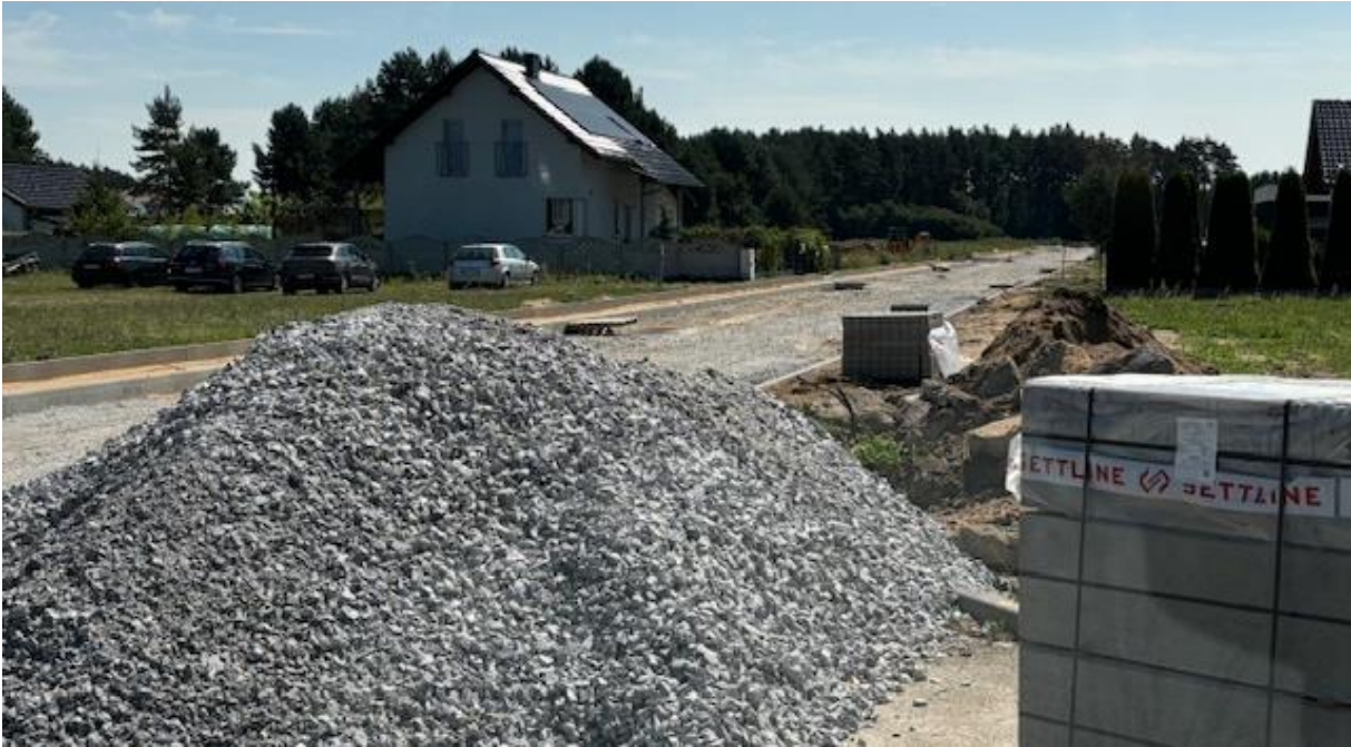
Neubaugebiet und klassische Dorfsiedlung mit langgestreckten Hofstellen