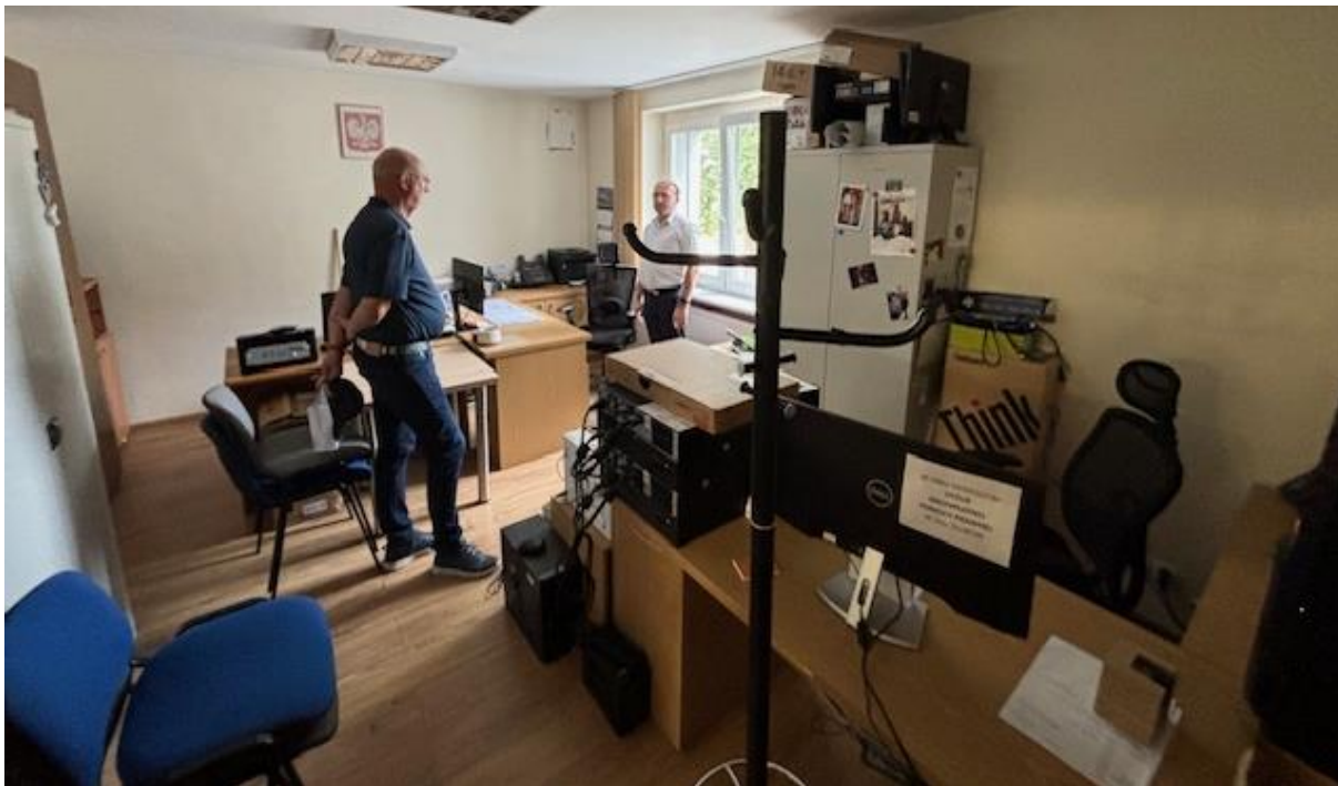
Büroraum, hier die IT.