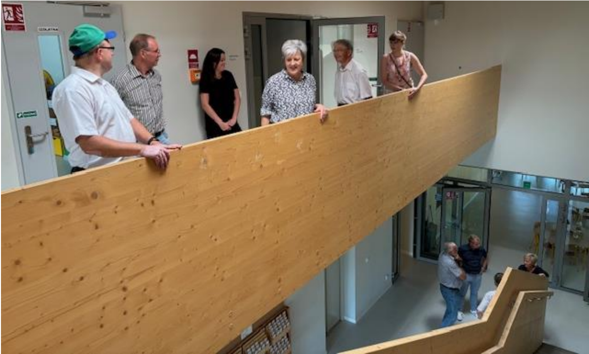
Großbetrieb KiTa: Platz für 40 U-3-Kinder und bis zu 125 Ü-3 Kinder in fünf Gruppen: Die jüngst für rund 1,6 Mio. € gebaute KiTa. Unten li: Arbeitszimmer der Schulleitung