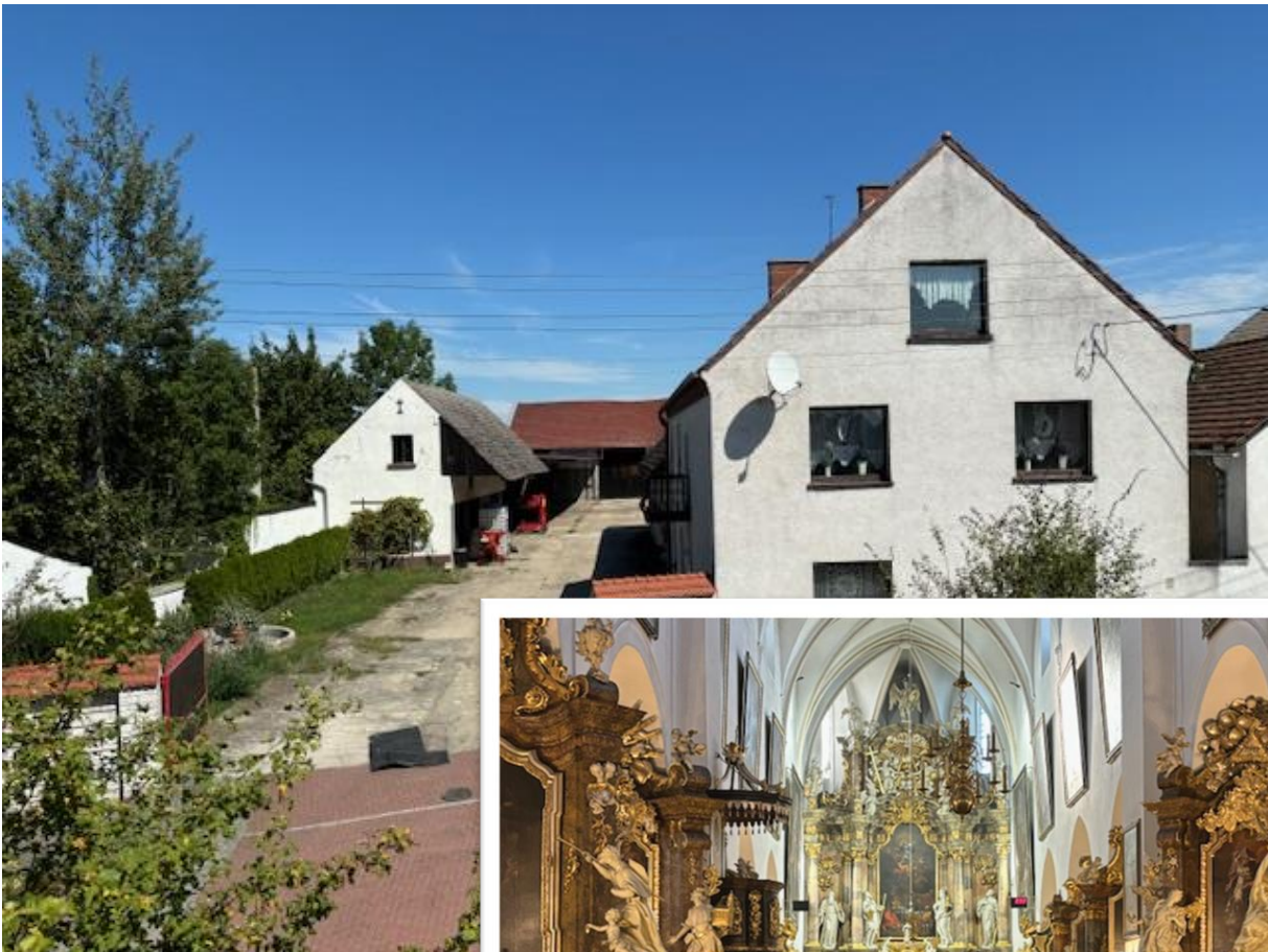
Die barocke Klosterkirche ist das kulturelle Zentrum der Ortsgeschichte und der Gemeinde